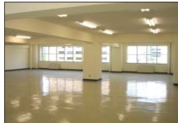
多目的エリア部分