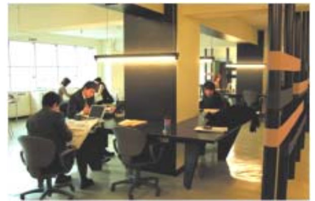
フリーアドレスデスク